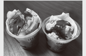
▲ 屋台トッポギ (甘辛・黒蜜きなこ)