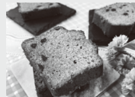
▲ 様々なオリジナルケーキや、備前スイーツをご用意

※新型コロナウイルスの感染拡大の防止対策として、イベントは屋外特設ブースで開催し、飲食のご提供は使い捨て容器を使用いたします。 お客様におかれましても、マスクの着用、手の消毒などの感染防止の取組に、ご理解・ご協力をお願いいたします。