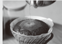
▲ スペシャルティコーヒー